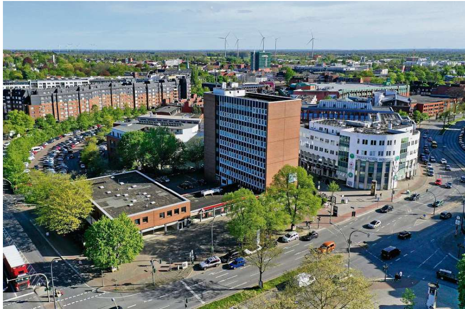
Der Komplex rund um das Haspa-Hochhaus in Lohrbrügge: Fünf Architektenbüros werden in den kommenden Monaten ihre Ideen zum neuen Gebäudeensemble ausarbeiten, der auch den Einstieg zur Fußgängerzone Alte Holstenstraße attraktiver machen soll.

Denkbar wäre jedoch neben einem rassistischen Motiv auch ein übereifriger Sozialdemokrat: Der SPD-Kreisvorstand hatte beschlossen, nur die drei Spitzenkandidaten der Liste an Straßen zu plakardieren.